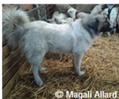
Chien de Montagne des Pyrénées

L'utilisation du chien de protection en élevage est ancienne, due à sa capacité à dissuader les intrus d'approcher du troupeau. Ce chien de travail, dont il existe une cinquantaine de races aujourd'hui, est généralement massif, de type molossoïde, avec une tête ronde et des oreilles pendantes, inspirant ainsi confiance aux herbivores qu'il doit protéger..