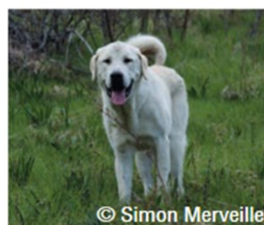
© Simon Merveille Berger d'Asie centrale