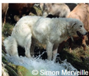
© Simon Merveille Berger de la Maremme et des Abruzzes