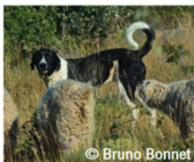
© Bruno Bonnet Cão de Gado Transmontano