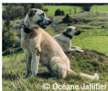
© Océane Jallifier Chien de berger Kangal