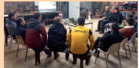
Echange technique sous un hangar sur le thème de la fertilisation des céréales d'hiver au printemps