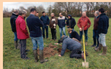
Observation de profils de sol lors d'une formation avec le GABB 32