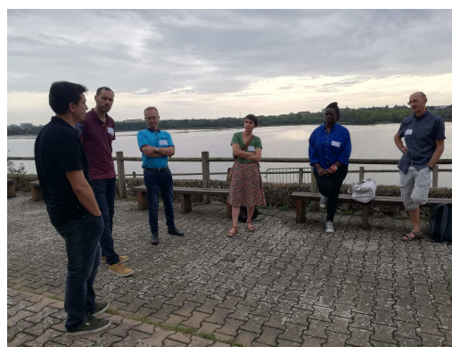
Un atelier « Foire aux réussites » en plein air...