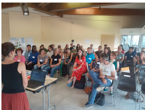
Présentation de la journée

Une journée conviviale d'échanges et de partage d'expériences